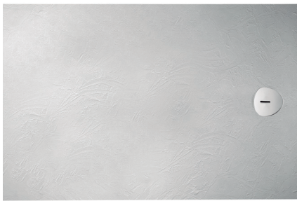
STREET A 900-1800 | B 700-1000

(*) Découpe maximale recommandée, pour d'autres coupes, nous consulter.