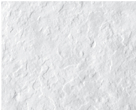
PIZARRA L 400-1300 | H 700-2500

Les caractéristiques techniques peuvent être modifiées sans préavis. Tolérances dimensionnelles +/-5mm.