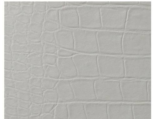
COCODRILO L 400-950 | H 700-2500