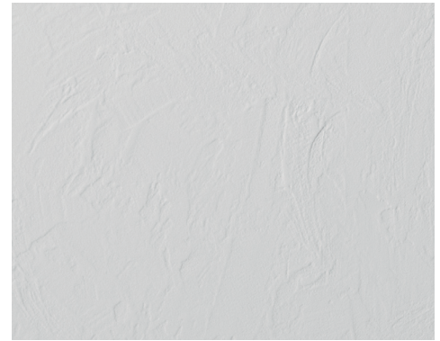
STREET L 400-1000 | H 700-2500