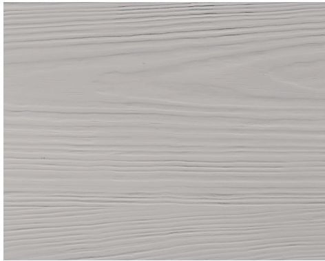
MADERA L 400-1000 | H 700-2500